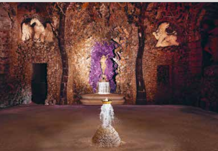
Nahoře současný pohled do Apollonovy grotty, dole vizualizace možné původní podoby.

Býval to nejmocnější muž na Moravě. Pak olomoucký biskup a kníže Karel z Lichtensteinu–Castelcorna, který v 17. století přinesl do svého regionu mimořádný hospodářský a duchovní růst a vzdělanost, zmizel na dlouhá léta v běhu dějin. A v posledních měsících se z nich opět vynořil: v Kroměříži, kde zanechal asi nejvýraznější stopu, se rozhodli na jeho počtu postavit pomník. Nápad má ale řadu odpůrců, jimž vadí temnější stránka Karlovy postavy: kromě společenského přínosu byl biskup totiž spojen s čarodějnickými procesy, které na Moravě vrcholily právě v 17. století.